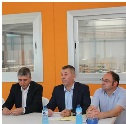
Conseller d'Economia, Rafael Climent en la reunió amb empresaris de Xeraco i Xeresa i els alcaldes.

Però no volem caure en l'error del passat de confiar només en un sector –com va ser la construcció– per això treballem per obrir-nos camí en l' economia turística valenciana .